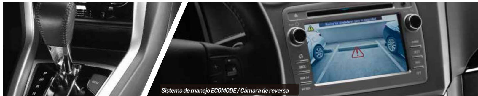
Sistema de manejo ECOMODE / Cámara de reversa

La Chevrolet Captiva Sport, cuenta con la tecnología Chevystar My Link ofreciendo en sus diferentes versiones servicios como: localización, recuperación e inmovilización del vehículo, ChevyStar APP (Apertura y cierre de seguros, luces y bocina, localízame, sígueme, alertas de velocidad y estacionado), avisos de pico y placa, Music Streaming, manos libres con reconocimiento de voz, pantalla táctil de alta resolución, visor de fotos y videos, servicio de conserjería para reservaciones, entre otros.