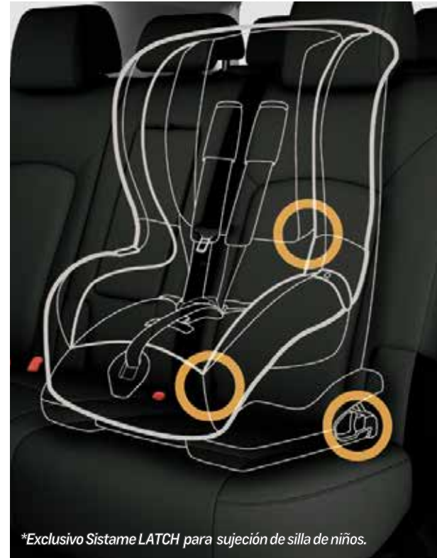
*Exclusivo Sistema LATCH para sujeción de silla de niños.

Chevrolet Captiva Sport es una todoterreno estilizada que te ofrece un manejo deportivo y lo último en comodidad y tecnología.