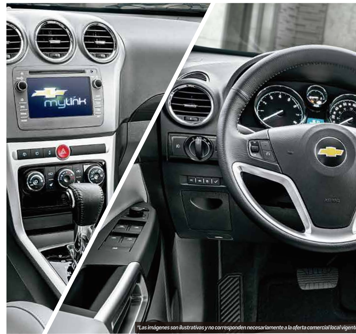
*Las imágenes son ilustrativas y no corresponden necesariamente a la oferta comercial local vigente